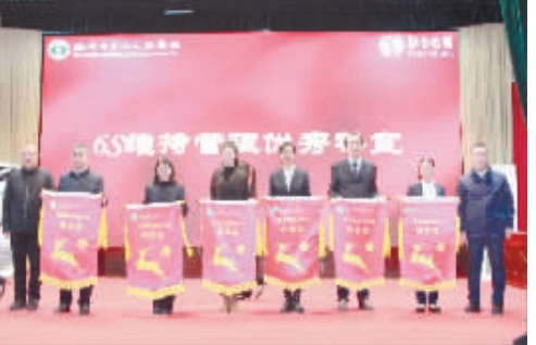
6S管理维持优秀科室奖:心血管内科重症监护室、胸外科、儿童重症监护室、神经外科、血液透析室、药学部