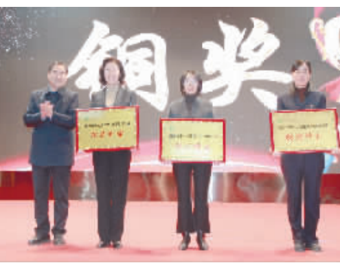
6S管理铜奖获得科室:护理部、感染管理科、财务科