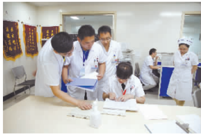
专家现场指导工作

鲜活的故事天天发生 身边的感动让冰雪消融 默默奉献,俯首感恩 那是践行千古不变的神圣