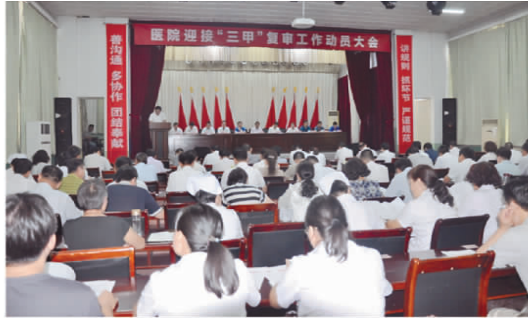
医院迎接三甲复审工作动员大会

自2017年8月开始,根据国家及山东省医院等级评审工作要求,结合我院自身工作实际,围绕三级医院复审工作积极行动起来,明确目标,成立工作领导小组,完善制度流程,制定迎评工作实施方案,加强督导检查,全院动员,全员参与,三甲医院复审成为我院今后一年多的中心工作,各部位、各科室积极行动起来,全力以赴投入到三甲复审工作中,各项工作有了较大起色,取得了明显的进步。