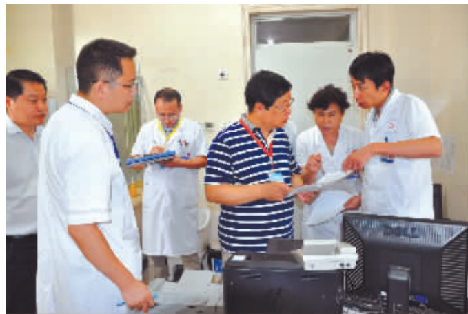
专家现场指导工作

(二) 认真学习领会三甲标准。评审标准是开展三级医院等级评审工作的主要依据,组织各科室工作人员认真学习《三级综合医院评审标准实施细则(2011版)》,结合科室管理职能,对照标准,逐条比对,找出差距,落实措施做好自身的评审工作。