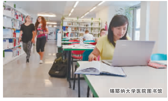
锡耶纳大学医院图书馆