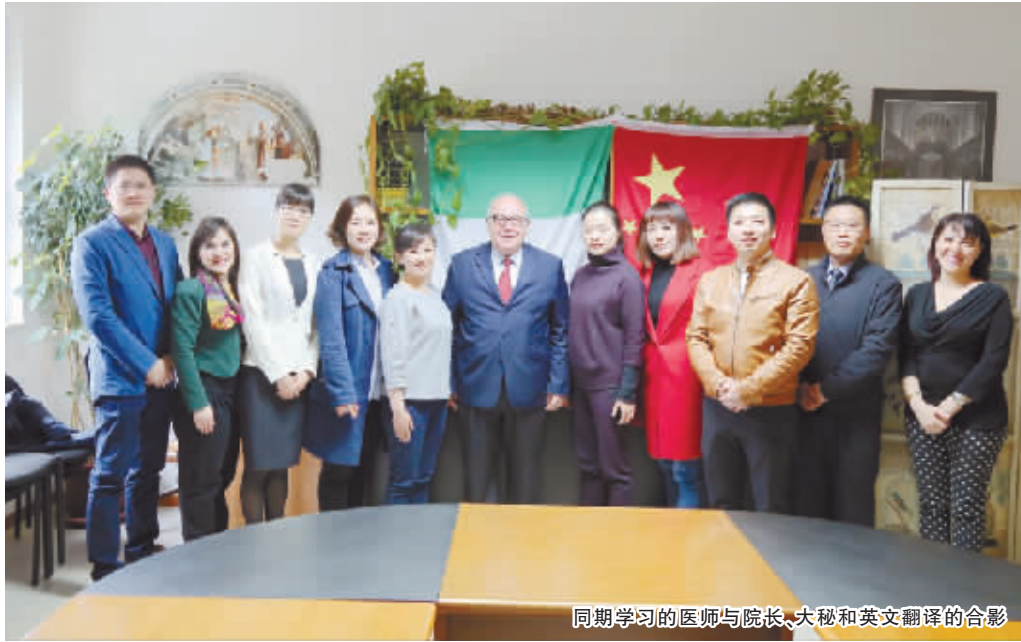
同期学习的医师与院长、大秘和英文翻译的合影

2017年4月至7月，我有幸进入意大利锡耶纳大学医院进修学习三个月，对意大利的医疗体系、锡耶纳大学医院运作、先进的麻醉技术及理念有了进一步的了解和认识。难忘这三个月与意大利医生的和睦相处及沟通交流，他们使我感受到了意大利科技与人文相结合的独特魅力，珍贵的学习经历不仅丰富了我的知识，开拓了我的视野，还更新了我的理念，开阔了我的胸怀。