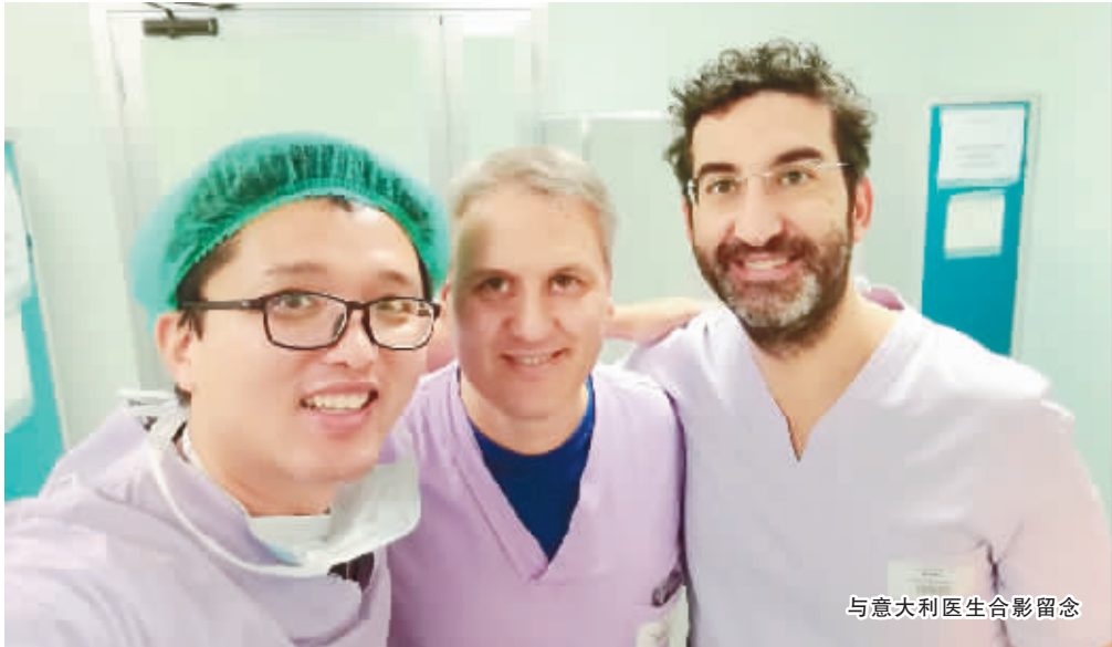
与意大利医生合影留念

能,防止人满为患,保证绿色通道通畅。患者送入急诊室后,在未查明病情以前,家属只能在诊室门口等,整个抢救室安静有序,给医务人员创造了良好的诊治环境,意大利具有完善的急救急救医疗服务体系,其突出特点是118急救指挥中心的分级调度。急救体系由公共医疗体系和救护志愿者协会组成。急救服务必须在3分钟之内出发,30分钟内到达医院。在救护车和直升机上都有相关的设备如便携式B超机、心电图机等,在救护途中就可以把辅助检查结果传递给急救中心的医生,负责从网络电脑上阅读并分析诊断,并及时联系沟通院内急救中心(急诊科)的医护人员做好院内急救准备。正因为有有这样及时先进的院外急救服务及院内急救系统,意大利的卒中患者可以在45分钟之内进行溶栓治疗。