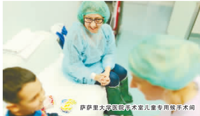
萨萨里大学医院手术室儿童专用候手术间