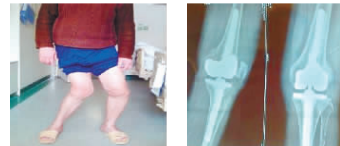
重度膝关节畸形的关节置换手术