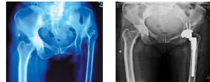
成人重度髋臼发育不良的人工髋关节置换术