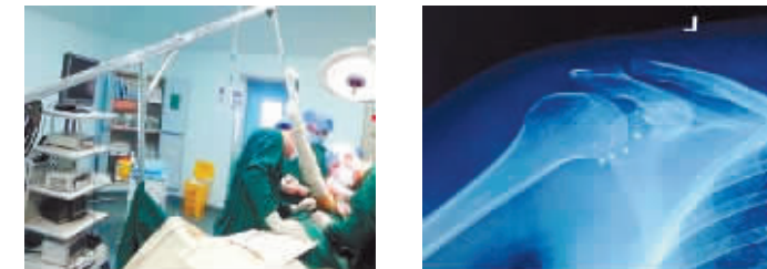
肩关节镜下肩袖修补手术