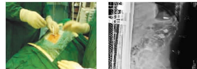
椎体成型及后凸成型术治疗老年骨质疏松性骨折