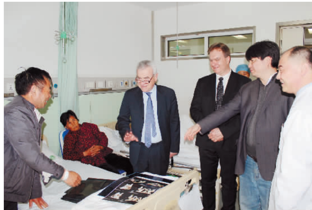
法国里昂大学骨科专家来院学术交流

展领域,坚持选派优秀中青年学术骨干赴国内外高水平医疗及科研机构研修深造,并参加国内外脊柱外科年会进行学术交流。近年开展了颈椎病的前/后路内固定手术,如前路钢板加钛网固定术;后路侧块钉棒及椎弓根系统固定术;后路开门手术;人工颈间盘置换术;腰椎退变性疾病的后路固定术;脊柱肿瘤的切除内固定术;脊柱的微创经皮通道下的内固定术;椎体压缩性骨折的球囊扩张椎体成形术;椎间孔镜下腰椎间盘突出切除术;并在省内率先开展了显微镜下的脊柱外科手术。其中,脊柱微创通道下内固定术及显微镜下微创治疗腰椎间盘突出症方面特色鲜明,在本地区具有较高的知名度。 3.创伤骨科在近关节及关节内骨折治疗方面的治疗始终保持国内领先水平,尤其骨折治疗的闭合复位内固定微创技术(MIPO技术)的应用、LCP接骨板,LISS技术,PFNA技术及国际最新的intertan系统等髓内钉内固定技术的开展,在本地区彰显了领头羊的实力。同时在骨盆及髋臼骨折的微创治疗上也取得了满意的临床疗效,大大缩短了患者住院时间,节省了医疗费用。 4.手足外科现有2个病区,90张床位,在治疗急诊手足外伤、手足部功能重建、周围神经损伤、手足关节损伤与疾患、先天性畸形、手足部肿瘤等诸多领域均居于省内先进水平,尤其2015年以来聘请上海第二军医大学长海医院张少成教授担任骨科名誉主任以来,陆续开展了臂丛神经及周围神经的显微修复手术,取得了较好的临床疗效。